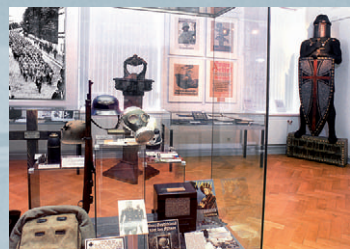
Computegrafik: Dr. Willi Kramer

Der Verein betreibt zudem das Café und den Shop im Teddy Bär Haus, deren Erlöse projektbezogen dem Museum zugute kommen.